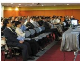
▲評審委員會由業界多位具代表性的專業人士組成。

由於首屆「優質建築大獎」取得令人滿意的成績，並獲得業界和社會人士廣泛的認同，故成功吸引到更多業界參加今屆大獎。今年，大會總共接獲共23個項目報名參賽，而通過首輪評審及實地考察後，評審委員會選出8個項目進入最後遴選，數目比去屆的5個為多，顯示今屆參賽項目的整體水平更高。