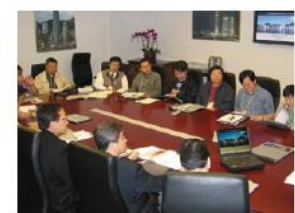
▲評審委員會對各個參賽項目作仔細評分，以選出各獎項誰屬。